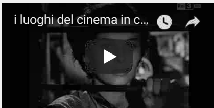
FOTOGRAFI IN CENTRO FROSINONE PIAZZA S. ORMISDA